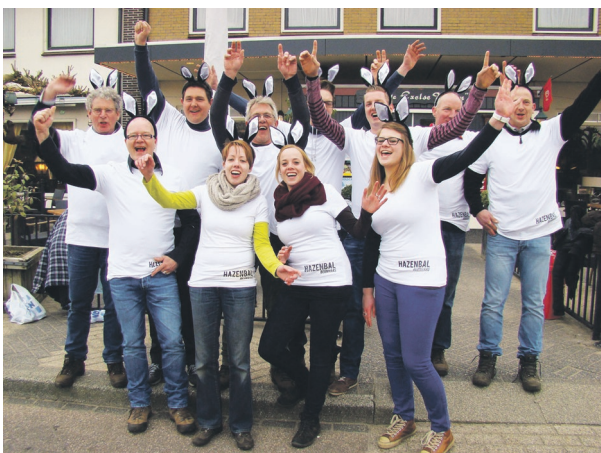
Commissie van het eerste uur 2013.