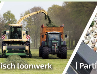
| Agrarisch loonwerk