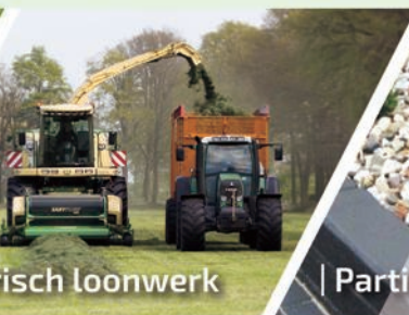
| Agrarisch loonwerk